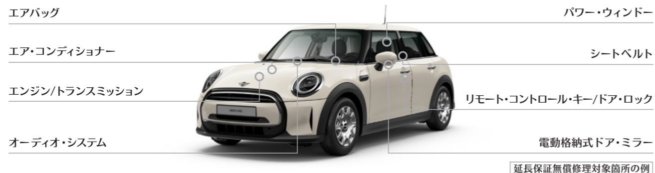
延長保証無償修理対象箇所の例

ご加入のプランに応じた保証期間中、対象箇所に不具合が生じた場合は無償修理をご提供いたします。