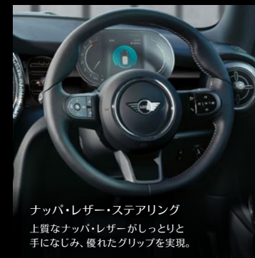
ナッパ・レザー・ステアリング 上質なナッパ・レザーがしっかりと 手になじみ、優れたグリップを実現。