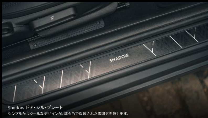
Shadow ドア・シル・プレート シンプルかつクールなデザインが、都会的で洗練された雰囲気を出す。