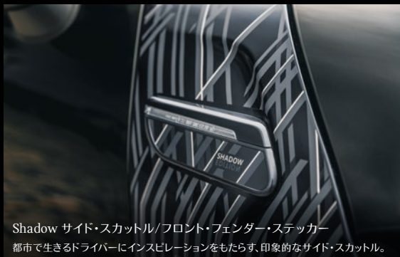
Shadow サイド・スカットル/フロント・フェンダー・ステッカー 都市で生きるドライバーにインスピレーションをもたらす、印象的なサイド・スカットル。