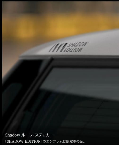
Shadow ルーフ・ステッカー 「SHADOW EDITION」のエンブレムは限定車の証。