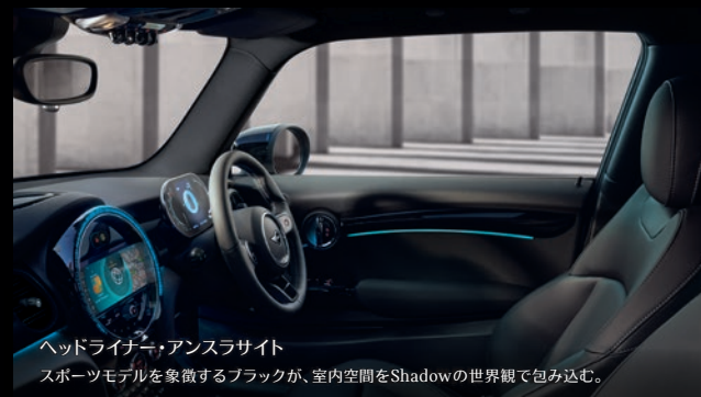
ヘッドライナー・アンスラサイト スポーツモデルを象徴するブラックが、室内空間をShadowの世界観で包み込む。