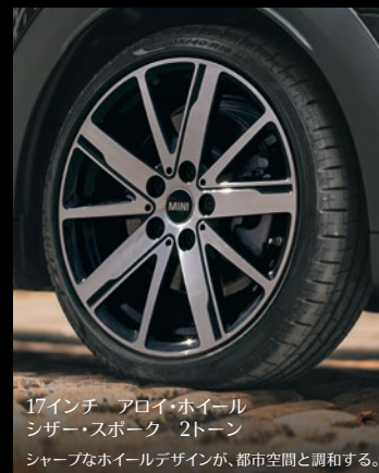
17インチ アロイ・ホイール シザー・スポーク 2トーン シャープなホイールデザインが、都市空間と調和する。