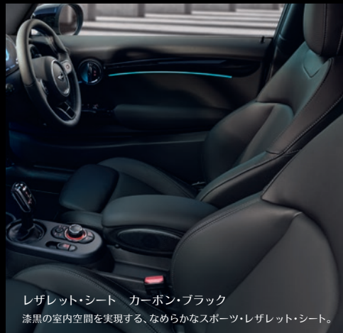
レザーレット・シート カーボン・ブラック 漆黒の室内空間を実現する、なめらかなスポーツ・レザーレット・シート。