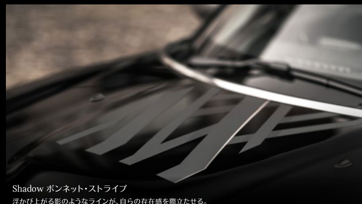
Shadow ボンネット・ストライプ 浮かび上がる影のようなラインが、自らの存在感を際立たせる。