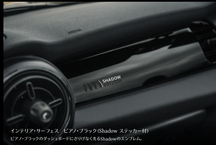
インテリア・サーフェス ピアノ・ブラック (Shadow ステッカー付) ピアノ・ブラックのダッシュボードにさりげなく光るShadowのエンブレム。