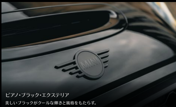
ピアノ・ブラック・エクステリア 美しいブラックがクールな輝きと風格をもたらす。