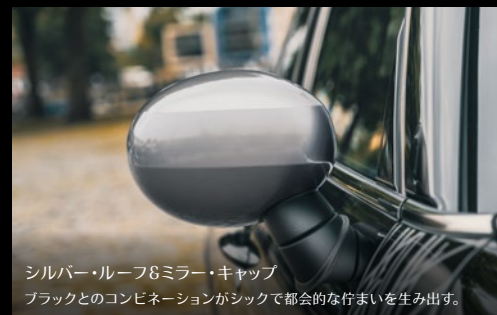
シルバー・ルーフ&ミラー・キャップ ブラックとのコンビネーションがシックで都会的な佇まいを生み出す。