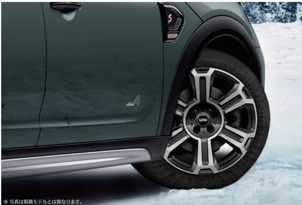
※写真は掲載モデルとは異なります。