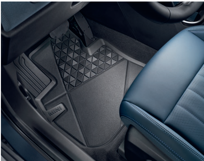
フロア・マット オール・ウェザー・マット