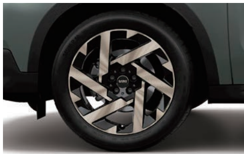
カレイド・スポーク 947 19" ティンテッド・ヴァイブラント

フロント/リア 8J×19 H2 ET:46 ¥108,570 (¥98,700) / 1本 3611 5A269E5