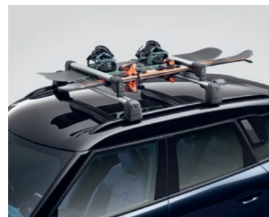
スキー&スノーボード・ホルダー

※トランスポーターションに使用している写真は掲載モデルとは異なる場合があります。