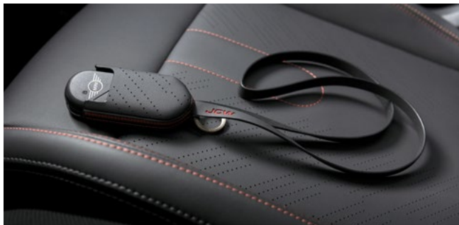
John Cooper Works キー・ケース