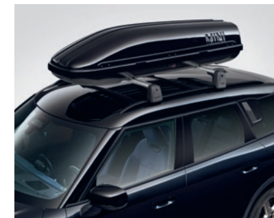
ルーフ・ボックス 320 ブラック