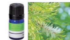
クリアティートリー