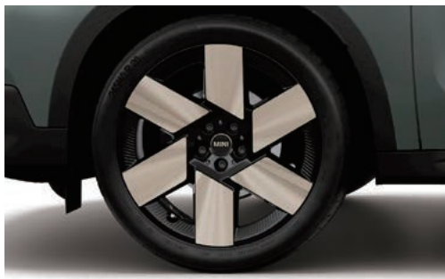
ウィンドミル・スポーク 946 20" ティンテッド・ヴァイブラント

フロント/リア 8J×20 H2 ET:46 ¥117,700 (¥107,000) / 1本 3611 5A269E4