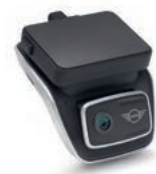
フロント・カメラ

スマートなデザインとコンパクトなスタイリングで車内にすっきり溶け込むスタンダード・モデル。