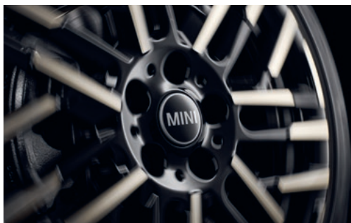
MINI フローティング・センター・キャップ・セット