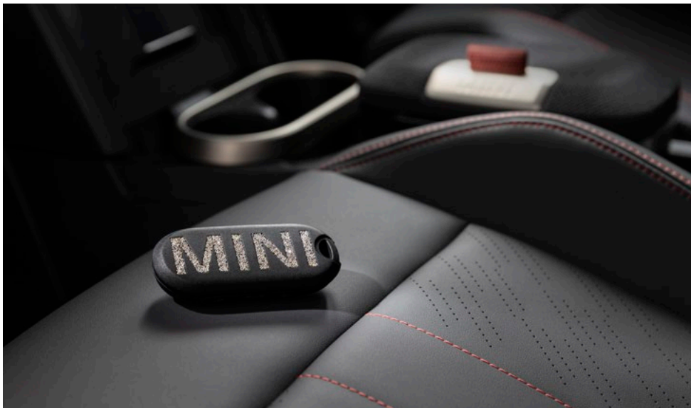
MINI キー・カバー クリスタル