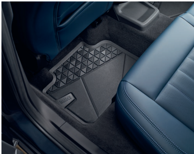
オールウェザー・フロア・マット