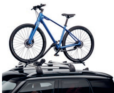
バイク・ホルダー