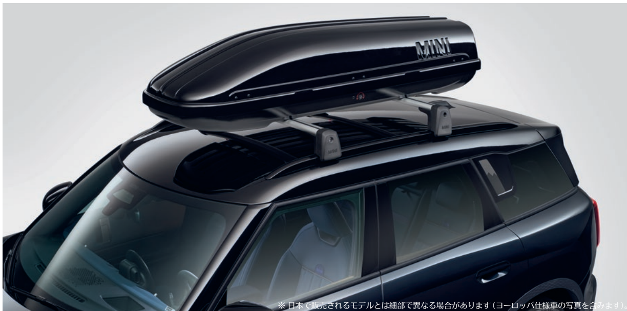
※日本で販売されるモデルとは細部で異なる場合があります(ヨーロッパ仕様車の写真を含みます)。