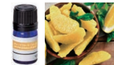
グレープフルーツ・ハーブ