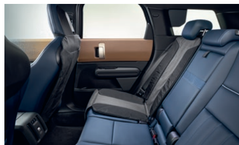
チャイルド・シート・マット シート・バック・カバー シート・カバー