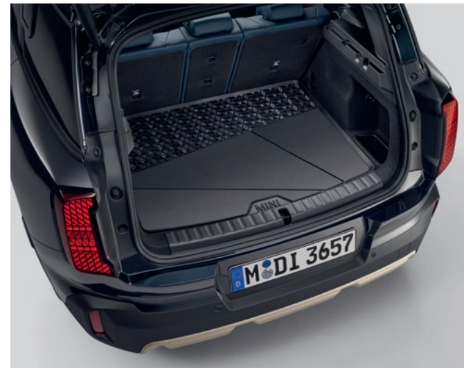
ラバー・ラゲッジ・ルーム・マット