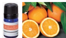
オレンジ・ユウカリ