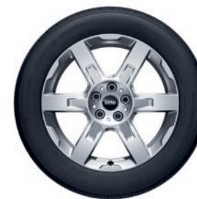
アステロイド・スポーク 944 18" リファインド・シルバー

フロント/リア 7.5J×18 ET:50 ¥63,800 (¥58,000) / 1本 3611 5A269E0