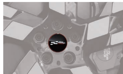
John Cooper Works センター・キャップ