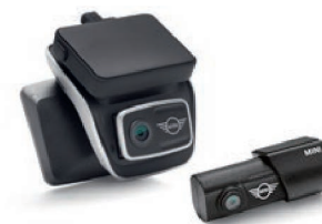
フロント・カメラ & リア・カメラ・セット

フロント & リア・カメラのセット。3.5インチ液晶タッチ・ディスプレイ付のProモデル。