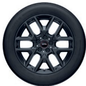
John Cooper Works Y スポーク 945 18" フローズン・ミッドナイト

フロント/リア 7.5J×18 ET:50 ¥66,990 (¥60,900) / 1本 3611 5A269E1