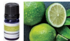
シトラス・ライム