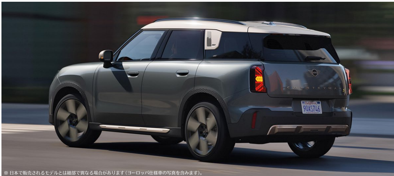
※日本で販売されるモデルとは細部で異なる場合があります(ヨーロッパ仕様車の写真を含みます)。