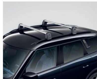
ベース・サポート