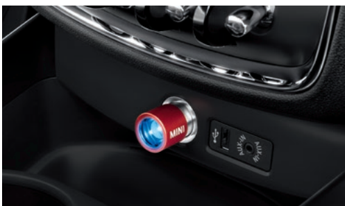
MINI LED ライト