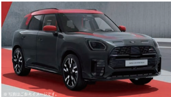
※写真はご参考イメージです。