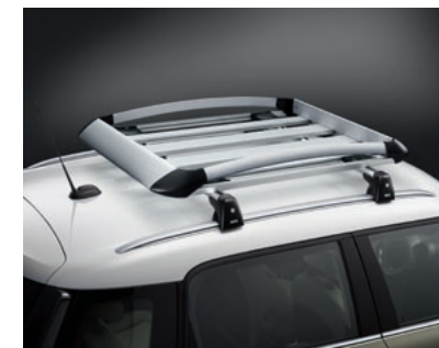
ラゲッジ・ラック