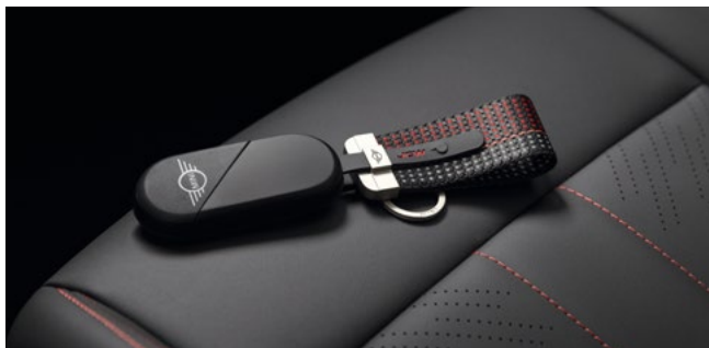
John Cooper Works キー・ベルト