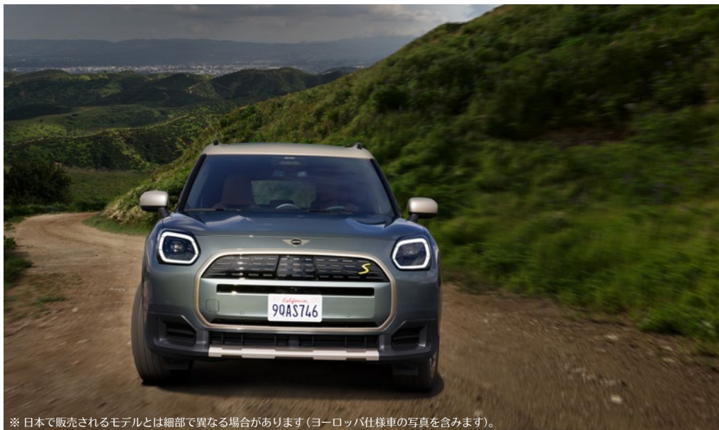
※日本で販売されるモデルとは細部で異なる場合があります(ヨーロッパ仕様車の写真を含みます)。