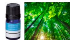
クリーンフォレスト