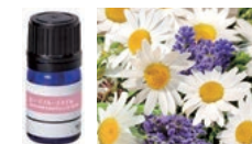
ピースフル・スマイル