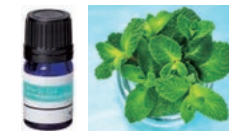
クリーン・ミント